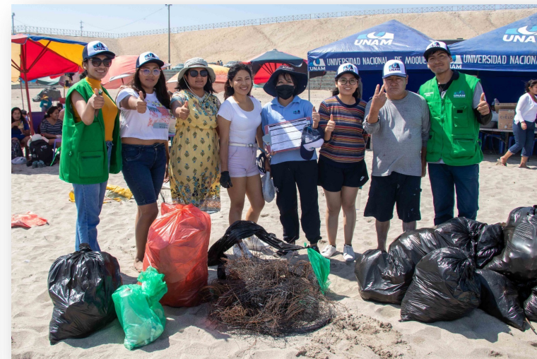
Evidencias de lo encontrado en la playa