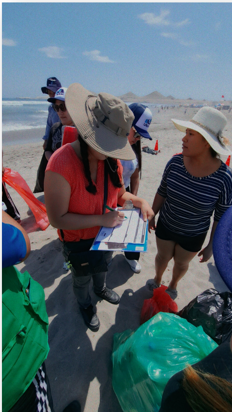
Registro de lo recolectado