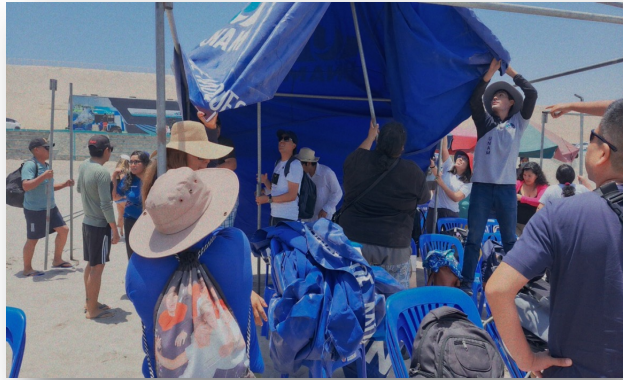
Armado de toldos