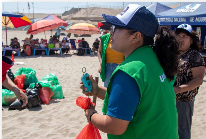
Pesado de basura