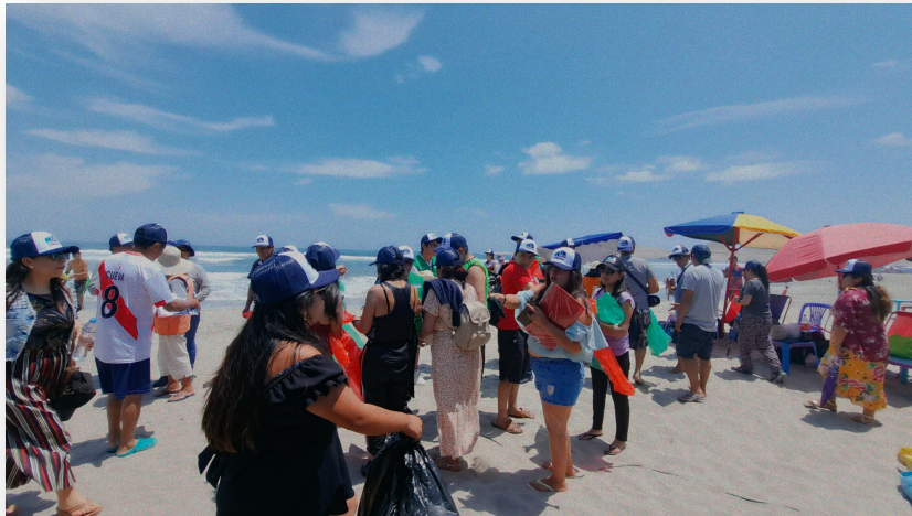
Conformación de equipos